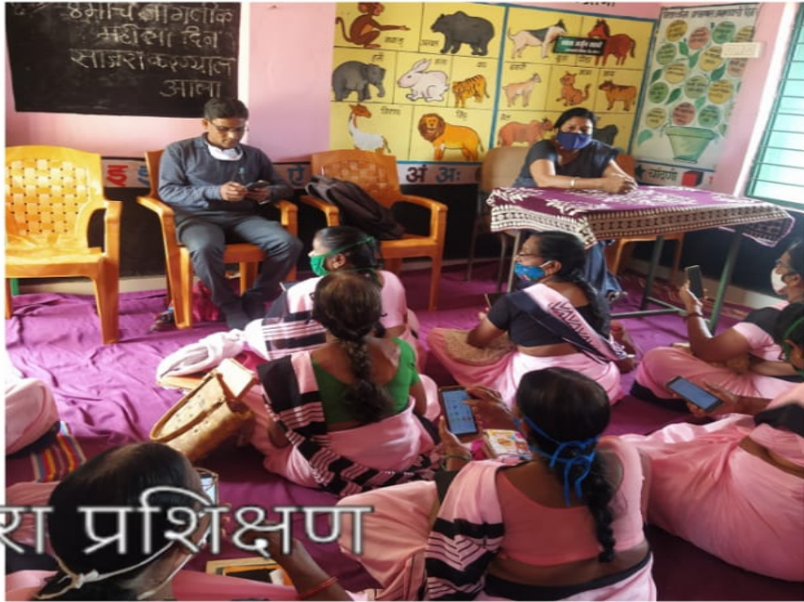
जवरा बोडी पोषण टूँकरा प्रशिक्षण