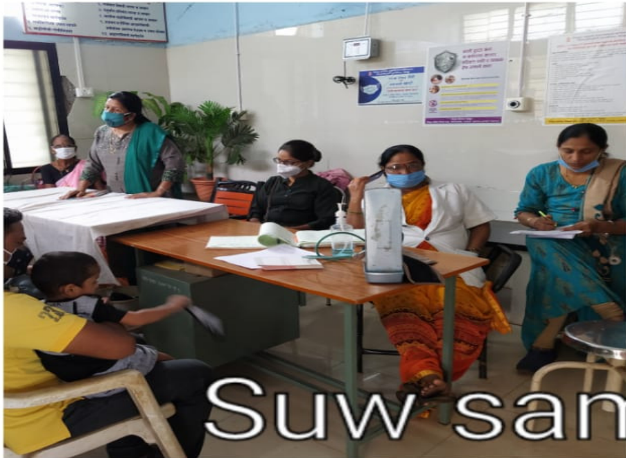
Suw sam durdhr