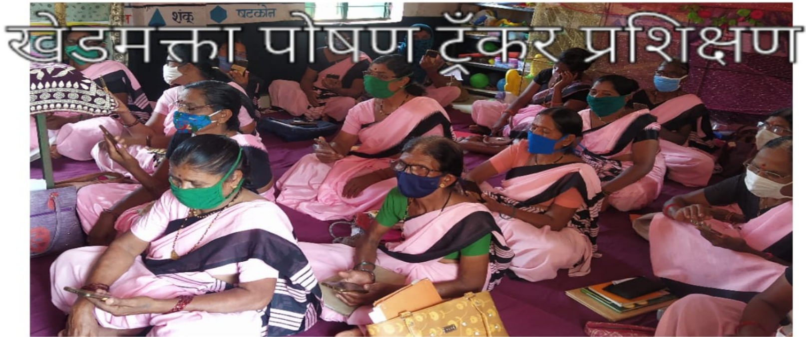
खेडमत्ता पोषण टूँकरा प्रशिक्षण